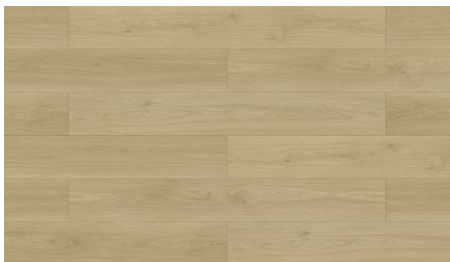
SWIFT RAPIDS RLAACCPSWIF