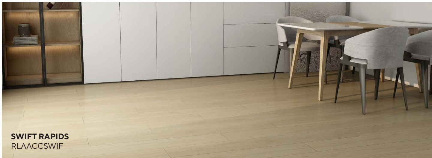
SWIFT RAPIDS RLAACCSWIF