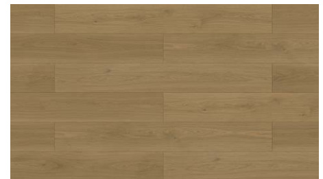
TURTLE LAKE RLAACPTURT