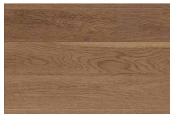
WHITE OAK NATURAL OAK RHWGLEN5NATUR