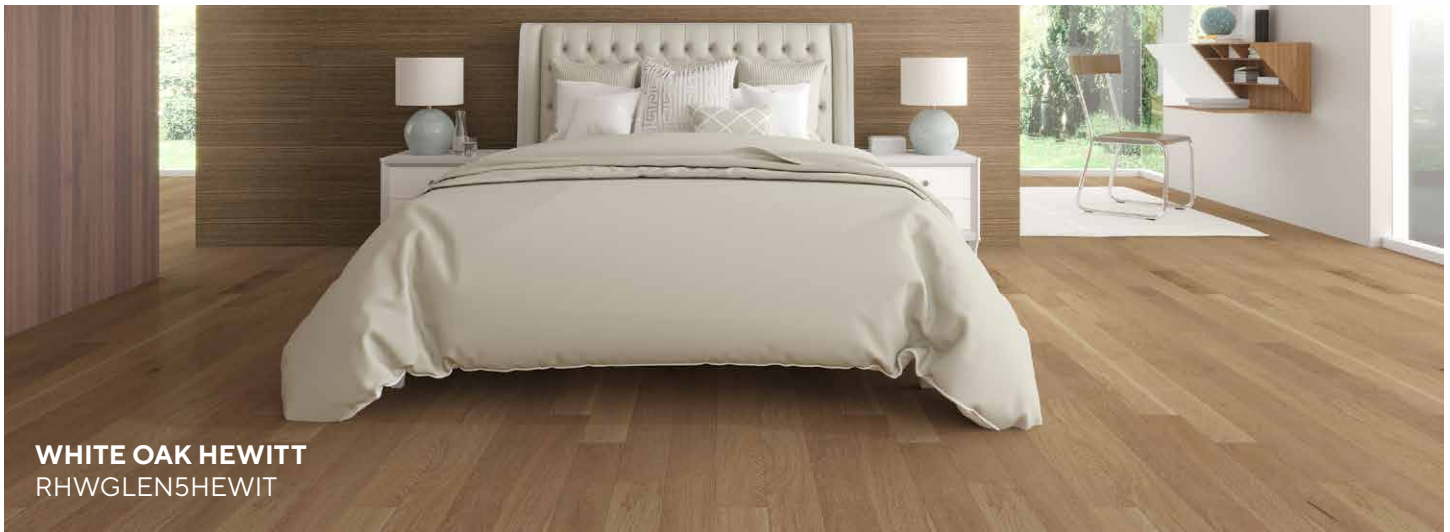
WHITE OAK HEWITT RHWGLEN5HEWIT