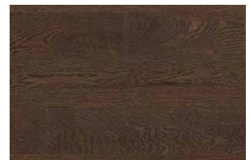
WHITE OAK CHESTNUT RHWGLEN5CHEST