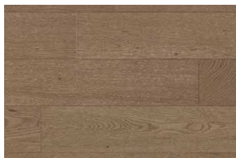
WHITE OAK HEWITT RHWGLEN5HEWIT