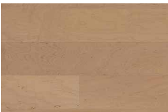
MAPLE NATURAL RHWGLEN5MNATU