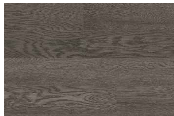
WHITE OAK CASSIDY RHWGLEN5CASSI