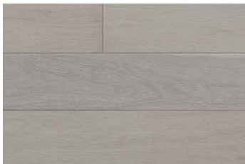
WHITE OAK HEBRIDES RHWGLEN5HERBR