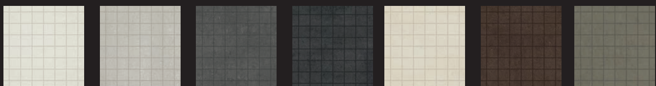
Lotus Mosaic 12"x12" / 30x30 cm Cloud Grey Mosaic 12"x12" / 30x30 cm Java Mosaic 12"x12" / 30x30 cm Nero Mosaic 12"x12" / 30x30 cm Creme Mosaic 12"x12" / 30x30 cm Cocoa Mosaic 12"x12" / 30x30 cm Pulpis Mosaic 12"x12" / 30x30 cm