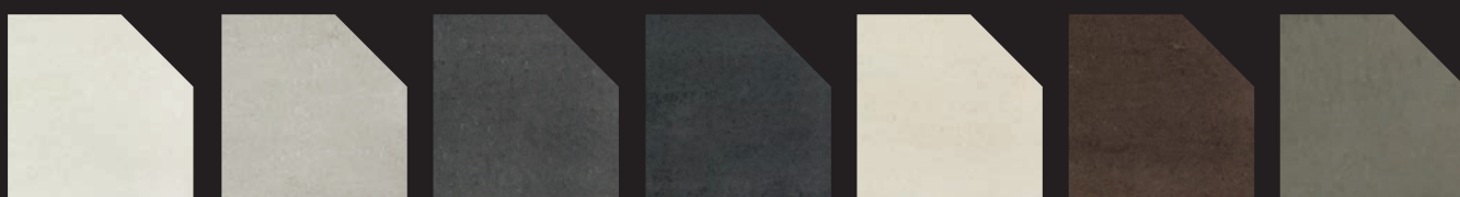
Stone Elements II Lotus Stone Elements II Cloud Grey Stone Elements II Java Stone Elements II Nero Stone Elements II Creme Stone Elements II Cocoa Stone Elements II Pulpis