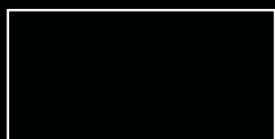
Pressed / Pressé 12"x24" / 30x60 cm